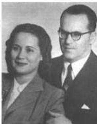
Guimarães Rosa e sua segunda esposa, Aracy.

Segundo D. Aracy, que compareceu a Israel por ocasião da homenagem, seu marido sempre se absteve de comentar o assunto já que tinha muito pudor de falar de si mesmo. Apenas dizia: "Se eu não lhes der o visto, vão acabar morrendo; e aí vou ter um peso em minha consciência."